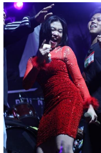
Gambar 5. Orkes WBLL Mahesa Musik

Acara ini menyediakan platform yang sempurna untuk pertukaran budaya antara Karang Taruna dan masyarakat setempat. Dari berbagai perlombaan hingga puncak perayaan kemerdekaan Republik Indonesia, kami berkesempatan untuk saling belajar dan menghargai keragaman budaya yang ada. Kegiatan lomba ini memungkinkan para pemuda untuk berperan aktif dalam mengorganisir dan mengelola acara besar, yang pada gilirannya membantu mereka membangun keterampilan, kepemimpinan, dan pengembangan diri. Melalui proses persiapan dan pelaksanaan lomba, peserta juga dapat mengasah keterampilan sosial seperti kerja sama tim, komunikasi, dan kepemimpinan. Selain itu, lomba seni dan kreativitas memberikan kesempatan bagi masyarakat Desa Hayam Wuruk untuk memperdalam dan menonjolkan bakat artistik dan kreatif mereka.