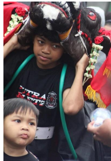
Gambar 1. Karnaval Kemerdekaan

Kedua, kita mengadakan acara lomba 17 agustus bersama karang taruna RT. 02,Desa Hayam Wuruk,Kecamatan Gondanglegi beserta semua masyarakatnya. Lomba yang pertama yaitu lomba Kardus Racing yang diikuti oleh semua anak-anak dari tingkat TK sampai SMP. Lomba ini sangat populer, terlihat gampang untuk dilakukan, tapi ternyata cukup sulit ditantang merangkak dalam kardus. Kesulitan yang dirasakan saat mengikuti lomba inilah yang diangkat sebagai gambaran sulitnya masyarakat Indonesia untuk memperjuangkan kemenangan pada masa penjajahan.