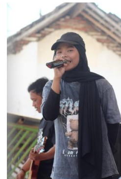
Gambar 4. Doorprize Pemenang, Undian, Panggung Gembira

Salah satu puncak acara yang paling dinantikan masyarakat Hayam Wuruk 2 adalah pertunjukan orkes yang meriah, menyenangkan, penuh hiburan dan menghibur pada malam hari.