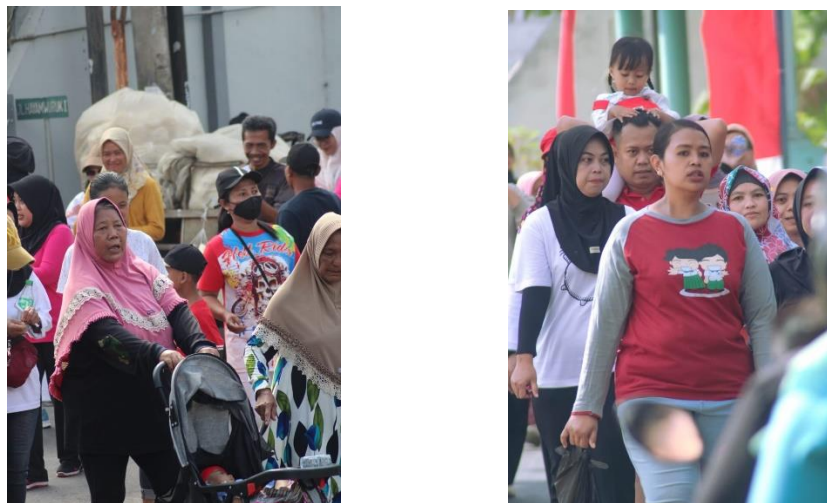
Gambar 3. Jalan Sehat

Dalam rangka memperingati Hari Kemerdekaan, warga RT 2 mengadakan kegiatan Jalan Sehat yang meriah dan menyenangkan pada keesokan harinya, sebagai wujud semangat persatuan dan kesatuan.