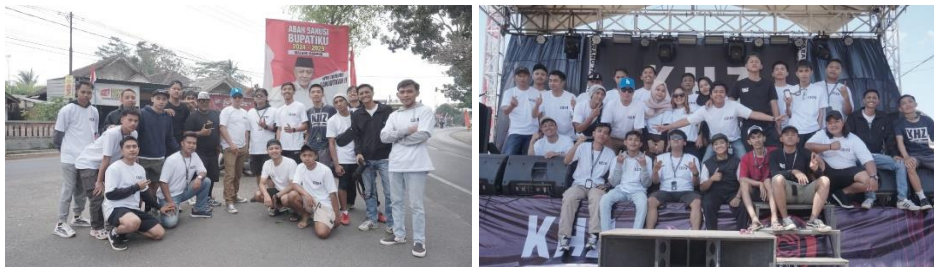
Gambar 6. Karang Taruna dalam Kegiatan